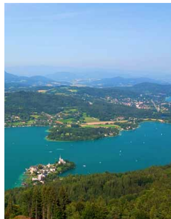
Im Sommer kann man am nahegelegenen Badeteich oder einem der Seen in der Nähe wunderbar relaxen.